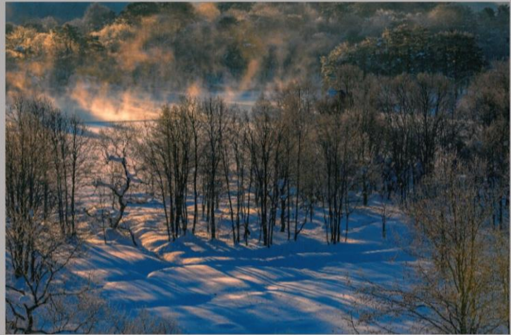
第14回 最優秀賞作品「早朝の小野川湖」