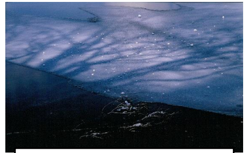
第14回優秀賞「冬の追憶」