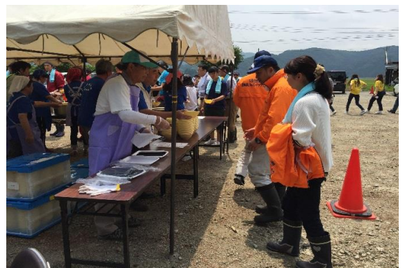
作業後の豚汁は格別

主催:猪苗代湖・裏磐梯湖沿水環境保全対策推進協議会 共催:福島県、郡山市、(一社)福島県産業廃棄物協会