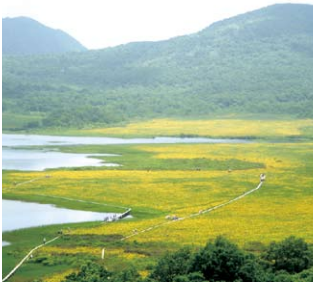
▶夏の雄国沼 黄色いニッコウキスゲの群落

ハイキングを楽しみつつ、中級者向けの『雄国せせらぎ探勝路』(約5km)、『雄国パノラマ探勝路』(約6km)から行ってみてはいかがでしょうか。