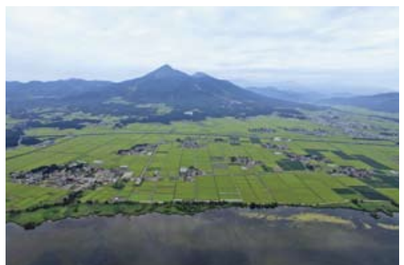
猪苗代湖と磐梯山空撮