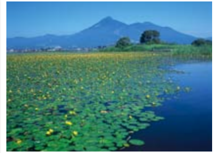
「アサザの咲く猪苗代湖」