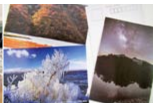
利用例2：広報物の作成