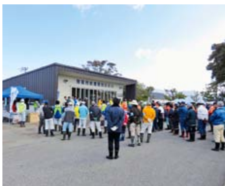
水環境センターでの開会式

※湖岸のヨシ原は天然記念物に含まれるものがあります。ポランテア活動等でヨシや樹木等の刈取りを検討する場合は、事前に公的機関にご相談をしてください。