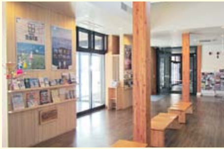
福島県産の木材で作られた 情報コーナー