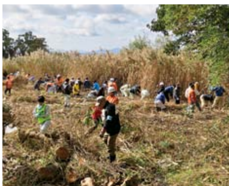
生い茂るヨシ原との格闘