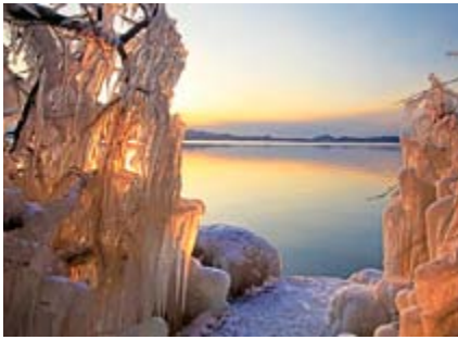
「湖畔のイルミネーション」