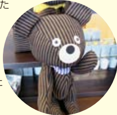
限定商品の 「猪苗代編」で作られた テディベア