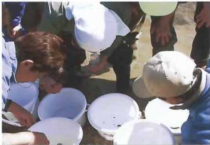
きれいな水に生息するヘビトンボなどがいました