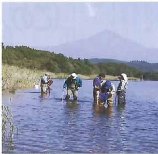
水生生物を採捕しました