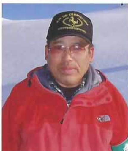
エコツアーコース巡視員