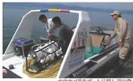
水中カメラをボートに積んで出発

昨年8月、県は初めて猪苗代湖の湖底の様子を撮影し、大変興味深い結果が得られましたので紹介いたします。