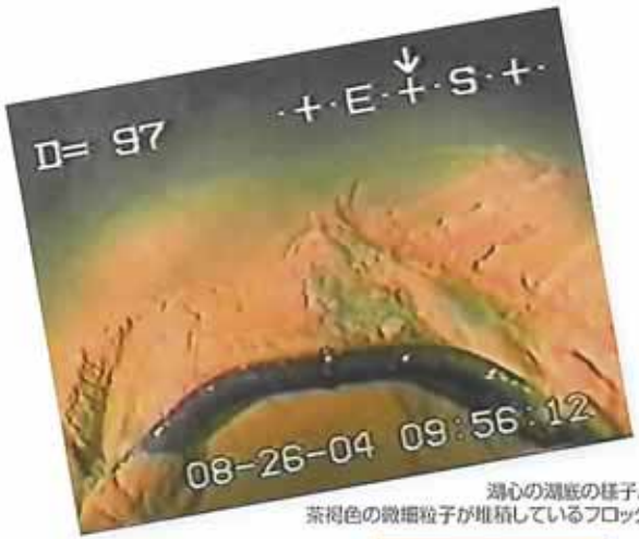
湖心の湖底の様子。茶褐色の微細粒子が堆積しているフロック