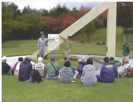
水源林保全のための意見を出し合い提言をまとめました