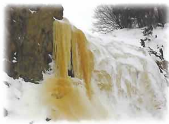
イエローフォール