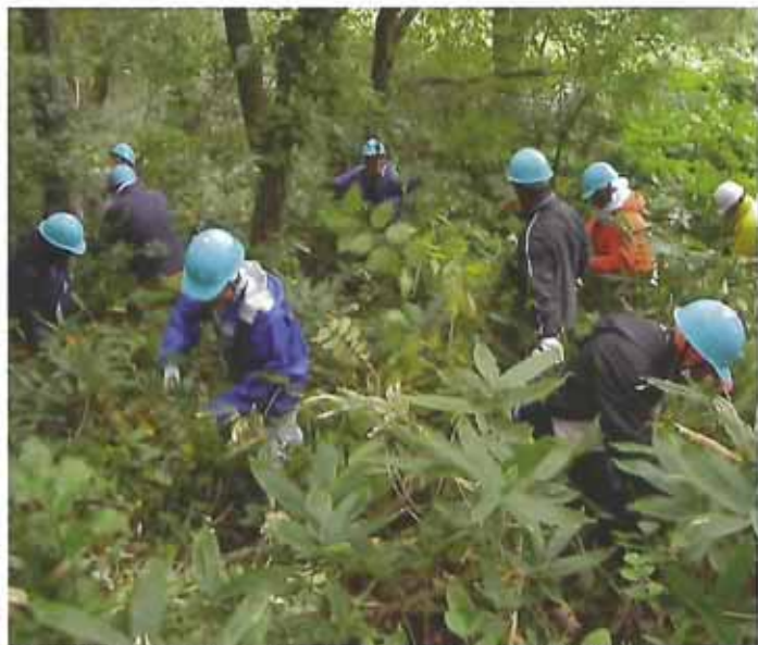
手入れの行き届かない水源林の森林整備をしました(つる切り、除伐作業)