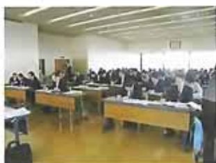
2月1日の連絡会議の様子

美しい猪苗代湖を守っていくためには、自分の出来ることを一人ひとりが一日一日積み重ねていくことが大切です。