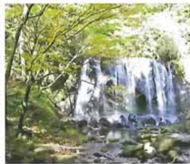
中ノ沢の温泉街から駐車場まで車で15分弱。