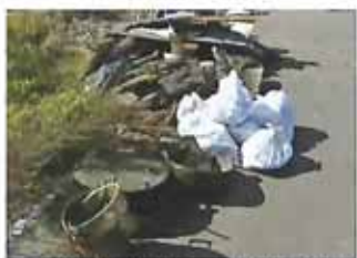
▲撤去されたゴミ (ほんの一部です)

*猪苗代湖での、これらの取り組みは、来年度以降も継続される予定です。 (時期及び場所は未定です)