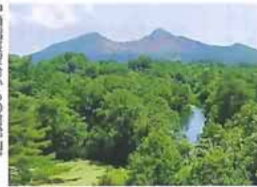
中瀬沼展望台からの磐梯山探勝路の全長は12kmほど。