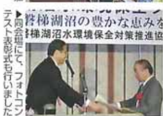
▶出席者の多く、多数に参加いただきました ▶同会場にて、フォトコンテスト表彰式も行いました