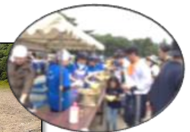
～作業後～ みなさんの御協力で きれいな浜になりました。

主催:猪苗代湖・裏磐梯湖沿水環境保全対策推進協議会 共催:福島県、郡山市、(一社)福島県産業資源循環協会