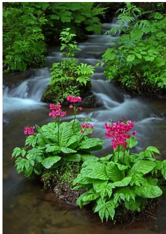
←第16回 優秀賞作品 「清流に咲くクリン草」