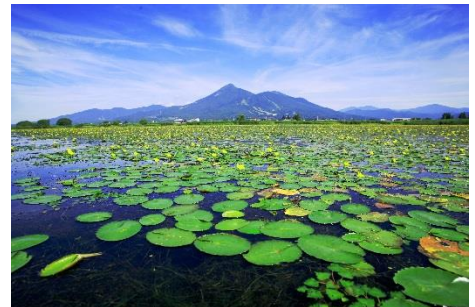
第16回優秀賞作品→ 「よみがえったアサザ」