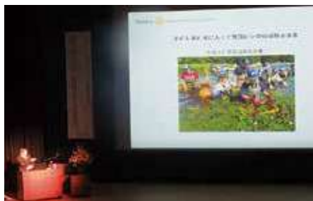
水環境保全活動事例発表

「猪苗代湖流域の魅力」猪苗代湖誕生のヒミツとは」と題し制作した映像の紹介を行いました。最後に、参加者を対象とした流域特産品プレゼントの抽選発表を行い、盛況のうちに幕を閉じました。