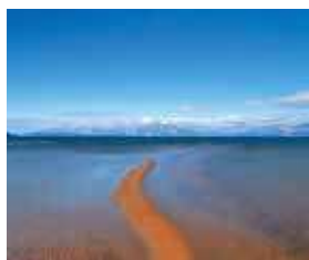
「エンジェルロード」