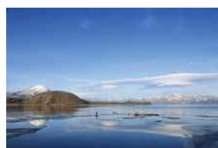
「つるし雲と白鳥と磐梯の詩」