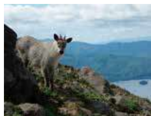
「磐梯山で山の神現る」