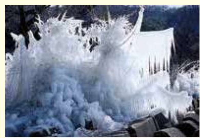
湖南七浜・浜路浜