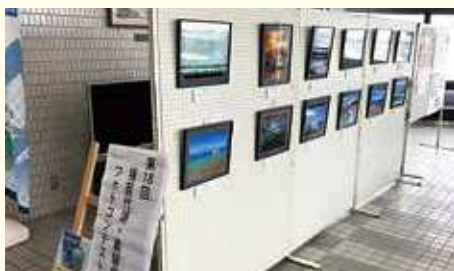
猪苗代町役場1階 町民ホール