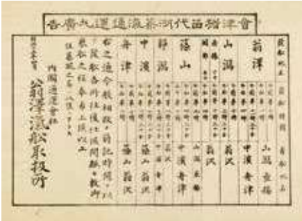
発着地・時間表 (通運丸運航表) (明治15年)