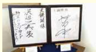
出演者のサインも飾られていました 左：浜辺美波さん 右：北川景子さん