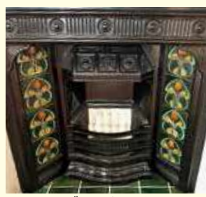
マジョリカタイル

「約束のネバーランド」のロケ地に選ばれ、「天鏡閣」は、「グレイスフィールドハウス」として登場しました。そのため、聖地巡礼の一つに数えられています。