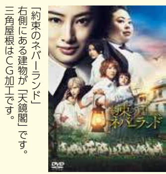
「約束のネバーランド」 Blu-ray & DVD 発売中 発売元：フジテレビジョン 販売元：東宝 © 白井カイウ・出水ぽすか/集英社 © 2020 映画「約束のネバーランド」製作委員会

なお、天鏡とは、猪苗代湖を指しており、建設された当時は、天鏡閣から猪苗代湖を望むことができたそうです。館内のみどころとして、暖炉のイギリス製マジョリカタイルがあげられます。チューリップをモチーフとしています。部屋によってデザインが異なるため、何種類のタイルがあるか数えてみるのもおすすめです。