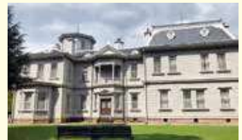
南から見た天鏡閣 (映画に登場します)

館長の長沼様よりお話を伺いましたので、一部ご紹介したいと思います。 Q 「天鏡閣」がロケ地に選ばれた理由は？ A 「日本国内で外国の洋館を表現できる館」であったようです。 Q 「約束のネバーランド」に関するおすすめの写真撮影スポットは？ A ポスターにも使用されている南側庭園の東側から見た外観です。 Q 「約束のネバーランド」の映画公開以降、反響はありましたか？ A 当館を見学されるお客様は、中高年のご夫婦連れやシルバードの親子連れ(小、中、高校生)の利用が増えました。劇場公開初日の舞台挨拶に参加された名古屋の方(浜辺さんのファンの方)が、勢いで翌日に天鏡閣にお越しくださったこともありました。 Q 映画撮影で苦労した点がありましたか？ A スタッフの皆さんに国指定重要文化財を撮影に使用するという意識をもって作業をしていただくことや、見学者に不快感を与えない、近隣住民の皆さんにご迷惑をかけないようにするなどの苦労がありました。 ぜひ、皆さんも映画を観て、天鏡閣を訪れてみてはいかがでしょうか。