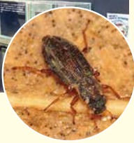
バンダイホソガムシ

また、平澤桂チームリーダーは、川内村の平伏沼で新種「ヒラサワツブゲンゴロウ」も発見しています!こちららも生体と標本を展示しています。 ぜひ、新種の水生昆虫「バンダイホソガムシ」と「ヒラサワツブゲンゴロウ」を見に、アクアマリンいなわしろカワセミ水族館を訪れてみてはいかがでしょうか。