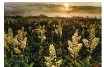
「コバイケイソウの朝」 堀越 靖さん（郡山市） 撮影場所：雄国沼