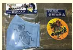
「バンダイホソガムシ」のマスク、ステッカー