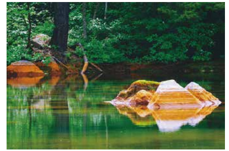
「銅沼グラデーション」 渡辺 宏さん（郡山市） 撮影場所：銅沼