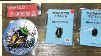
「ヒラサワツブゲンゴロウ」のステッカー、マグネット