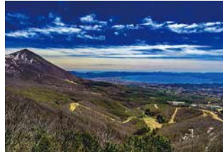
「猪苗代湖遠望」 泉田 実さん（三春町） 撮影場所：猫魔岳山頂