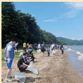
猪苗代湖クリーンアクション 2025vol.2(舟津公園)