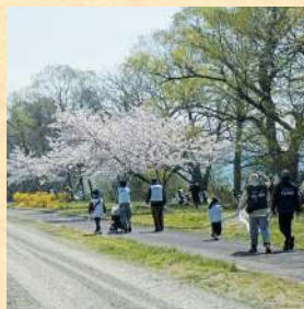
猪苗代湖クリーンアクション 2025vol.1(猪苗代湖北岸)