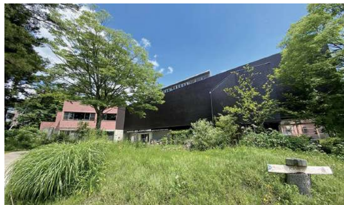
アクアマリンいなわしろカワセミ水族館

A まずは、地元の方々にもっと親しまれる水族館にしたいです。「お休みの日、どこに行こうか？」と考えた時に、気軽に候補へ挙がるような場所にしたいですね。夏休