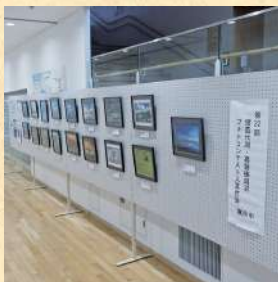
フォトコンテスト 入賞作品展示(コミュニティ福島)

4月7日～4月21日 福島県庁(福島市) 5月30日～6月26日 裏磐梯ビジターセンター (北塩原村) 7月14日～7月28日 コミュニタン福島(三春町) 8月1日～8月7日 コラッセふくしま(福島市)